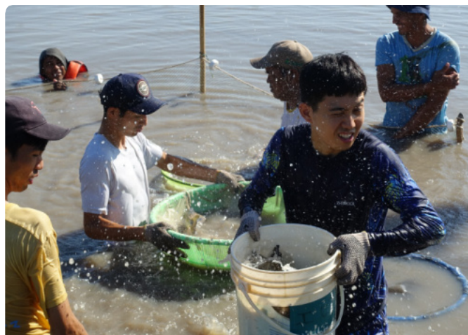
●成長したパクーの池替え(移動)作業。1月10日