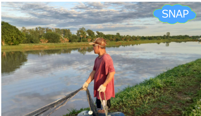
●この日は朝一番でパクーの水揚げ作業。美しかった空と池。12月21日