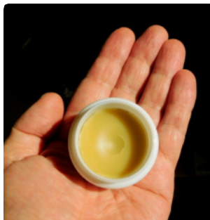
本。人件費がとんでも高くつく商品見ても。20グラム入りの商品でしよう。生産コストを下げられ、かつ効能が広まり、需要が増える。

A 現在20グラム入りで20ドルを想定しています。コストにはまだ正確な人件費が含まれていません。今のような手作業では、人件費がとても高くつくでしょう。生産コストを下げられ、かつ効能が広まれば、南北アメリカ、日本、その他の地域でも販売を目指します。