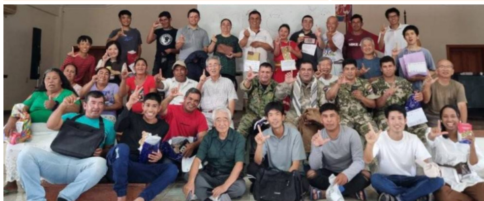
●レダの住人総参加で楽しいクリスマス会。皆さんプレゼントを手に。12月22日