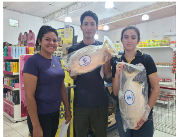
御得意様になってくれたお店「ソフィア」にて。