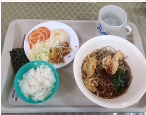
●もちろん大晦日の食卓に上りました。