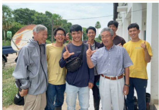
●翌日、米国へ帰国の途に就きました。