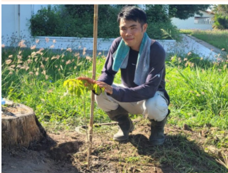
●元日にラパチョを植えたチャパボラ。