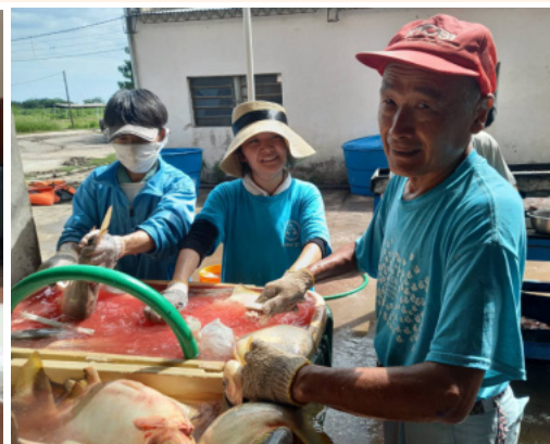
●皆で水揚げしたパクーの処理。12月21日