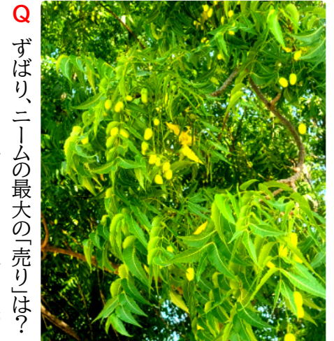
日本のセンダンに似たニームの実。