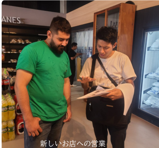
新しいお店への営業