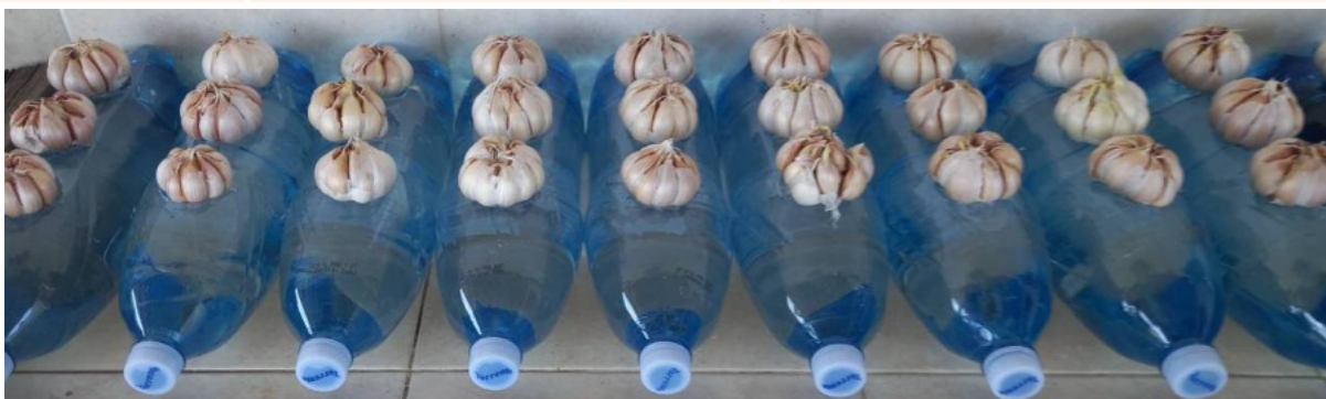
●右：水耕栽培の方法で、ニンニクを発芽させます。12月28日