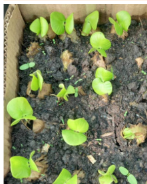
●左：発芽したケブラッチョブランコ。12月12日