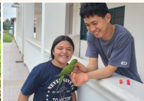
●野生のオキナインコの子供。1月12日