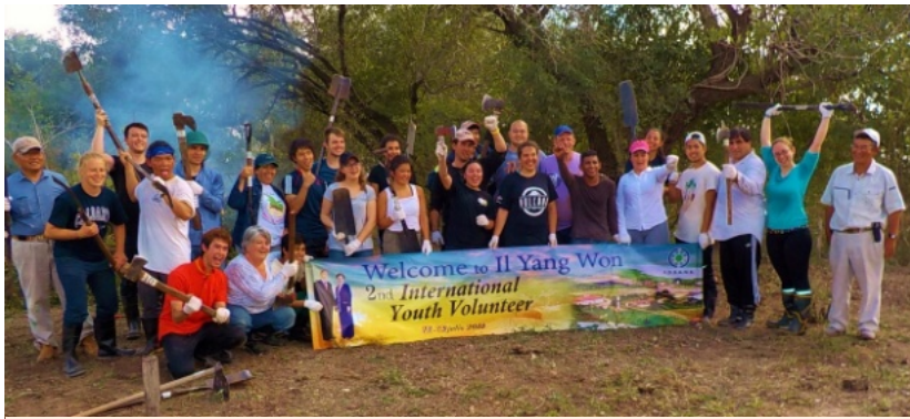
第2回 International Youth Volunteer (11か国 21名) 7月11-15日