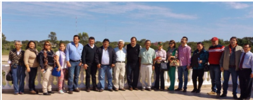
どうしても放流式に来たかった副大統領一行がレダに。6月30日