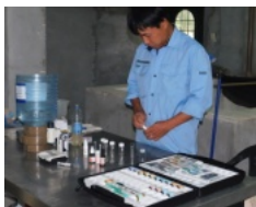
水質等の基礎研究