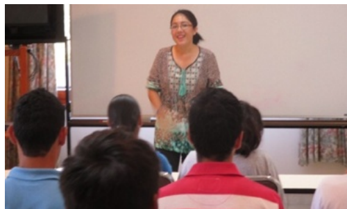
修練会スタッフは自前で。3月14日