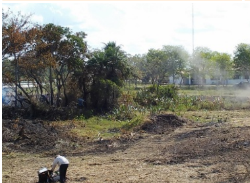
生息地環境そのままに自然動物園を準備