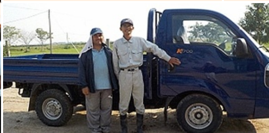
新しいトラックがレダに到着。3月14日