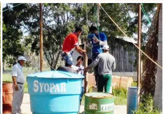
エビの養殖研究に向けて地下水を採取