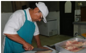
レダ産の食材で新製品開発