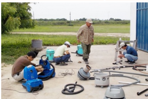
紅屋、大和田、中村、吉村、各氏作業中