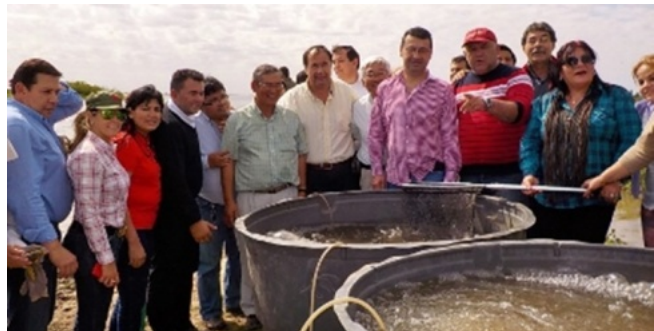
放流についてのブリーフィング。6月30日