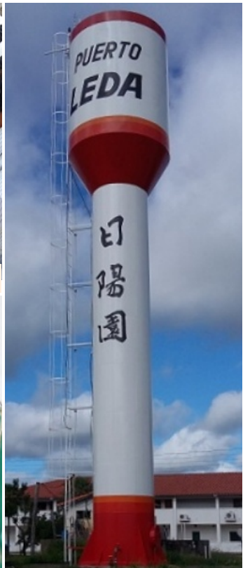
給水塔の修理が完了 3月