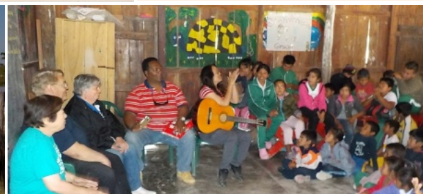
先住民の学校を訪問する米国牧師夫妻。7月28日