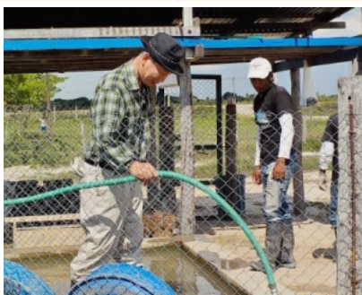
大元氏がカピバラの世話を担当