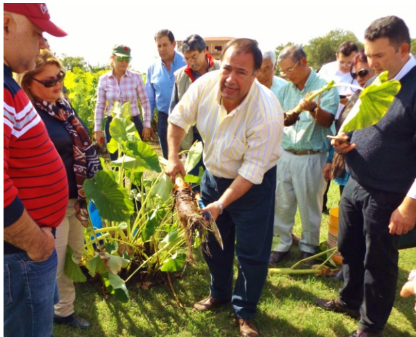
国会議員たちにタロイモの説明をするアフアラ副大統領。6月30日