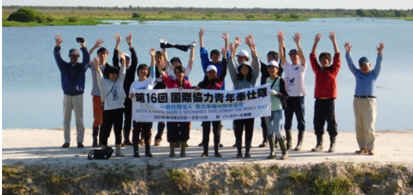
第16回 国際協力青年奉仕隊 (日本より15名) 8月31-9月2日