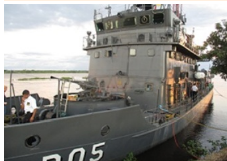
パラグアイ海軍艦が寄港。3月9日