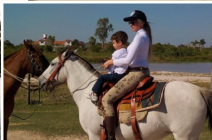
家族で休暇を過ごす議員。7月21日