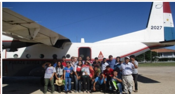
初めての21日修練会参加者が到着。3月14日