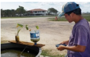
超低コスト養殖法実験