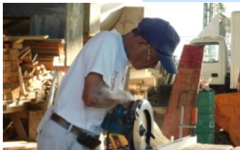
建築から家具・調度品まで