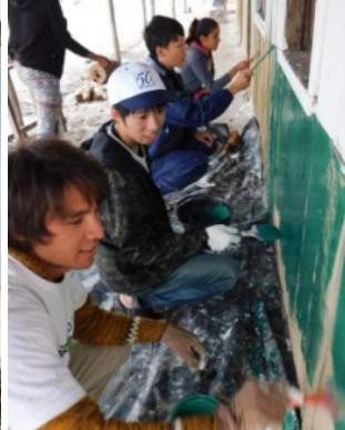
ディアナで奉仕 8月29日