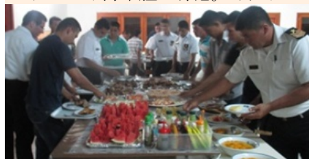
海軍の乗組員がレダで食事。3月9日