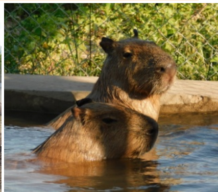
カピバラ家族ただ今増殖中