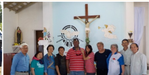
バイア・ネグラのカトリック教会を訪問。