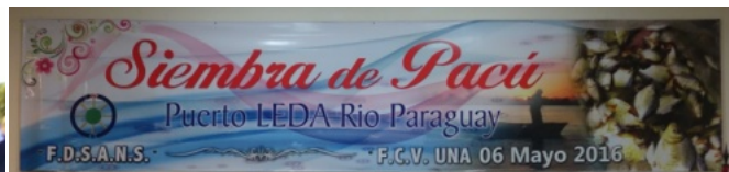
パクー稚魚放流式会場に掲げられたバナー。5月6日