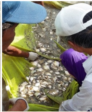
パクーの増殖と養殖推進