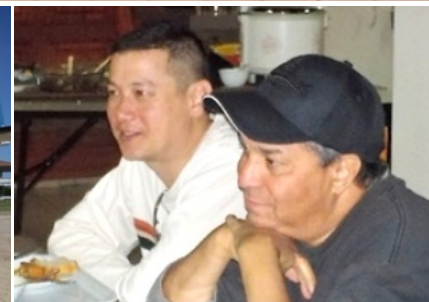
米国の社会活動家Evan氏。6月13日